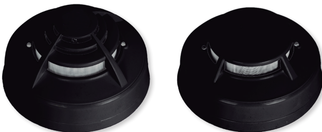
Otros colores, bajo petición